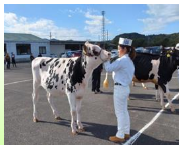
未経産リザーブグランドチャンピオン