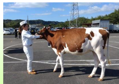
第2部リザーブチャンピオン