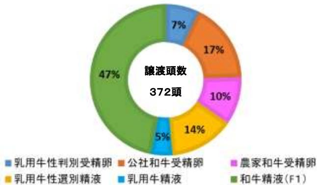
平成30年度譲渡牛の受胎内訳

平成30年度には、372頭の乳用初妊牛を譲渡させていただきましたが、その受胎内訳は左図のとおりでした。